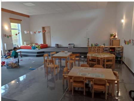
Innenraum Mechower Straße