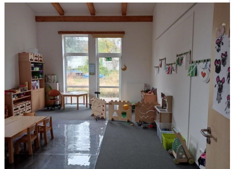
Innenraum Mechower Straße