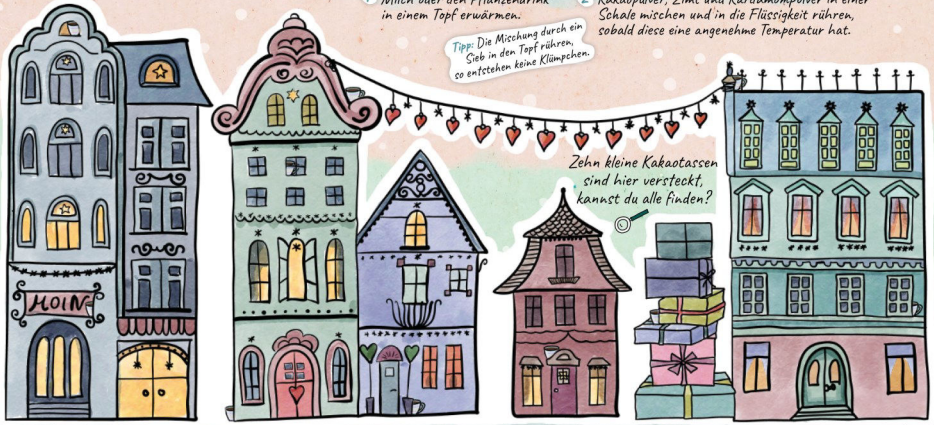
Kartusche: H. Essler, Illustration: Herbolffen, Sybilena © www.gewinnaktivitaeten.de

Tipps: Die Mischung durch ein Sieb in den Topf rühren, so entstehen keine Klümpchen.