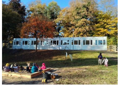
Herbststimmung am Wedenberg

Vielen Dank an die Eltern, Kollegen und Kinder der Zipfelmütze und an alle die uns in dieser anstrengenden Zeit unterstützt haben.