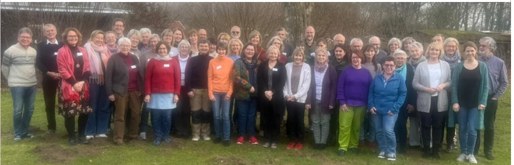
Die St. Georgsberger Kantorei bei ihrem diesjährigen Probenwochenende in Bad Segeberg