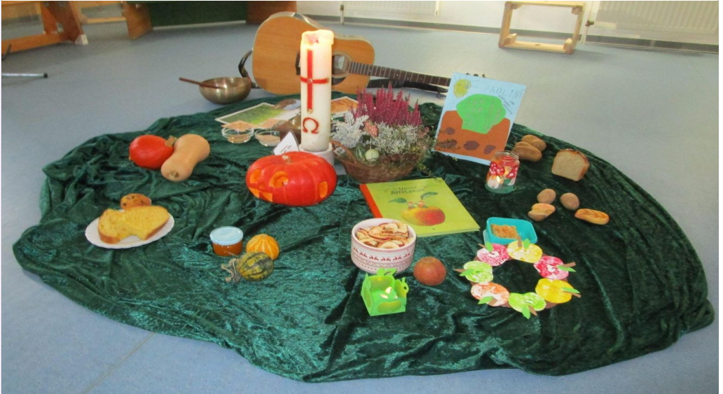
Erntedank in der Kita Buchholz

Ja, das geht! Und wie gut das geht... Aber der Reihe nach: